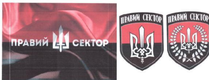
Рисунок 11. Атрибутика организации «Правый сектор».