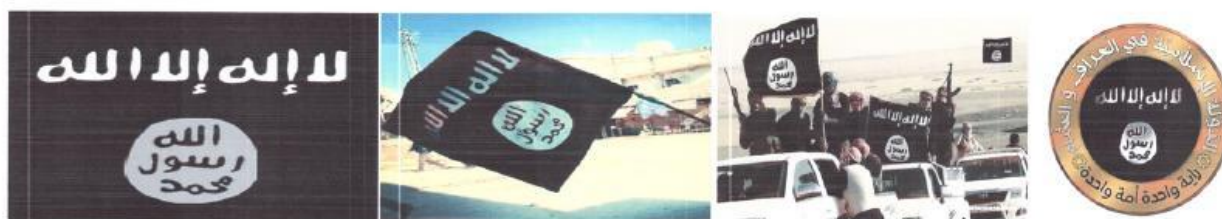
Рисунок 12. Символика организации «Исламское государство».