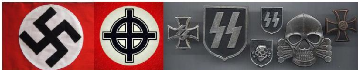
Рисунок 10. Нацистская атрибутика и символика.

Атрибутики, символики запрещенных в Российской Федерации экстремистских и террористических организаций: